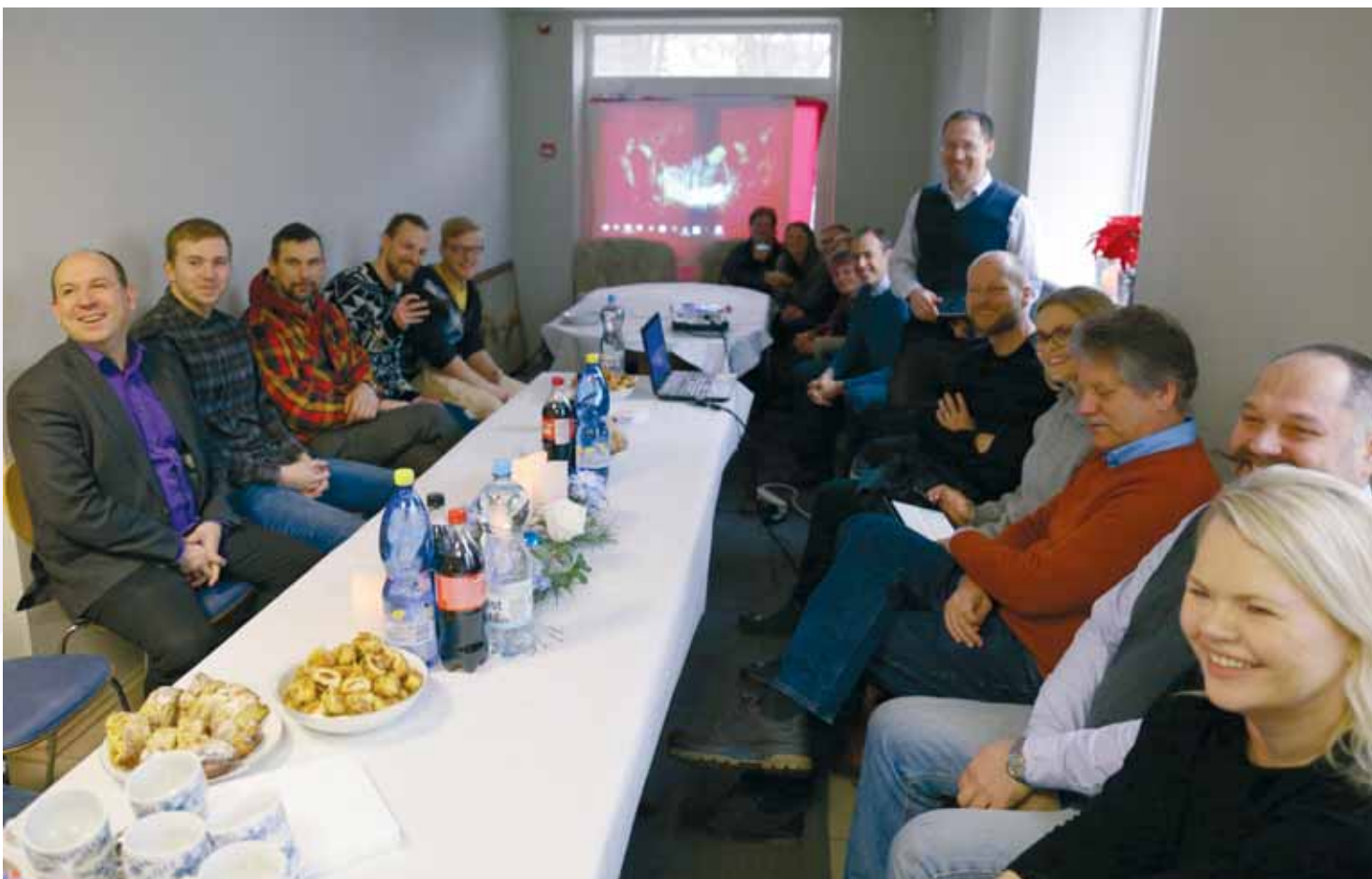
Ogres un Skienes baptistu draudžu kalpotāju sadraudzība Tabitas centrā.

Mācītājs Vidars ir vīrs Solvitai, kura atsaucās aicinājumam savākt naudu Norvēģijā, lai iegādātos ēku "Tabitas" centram.