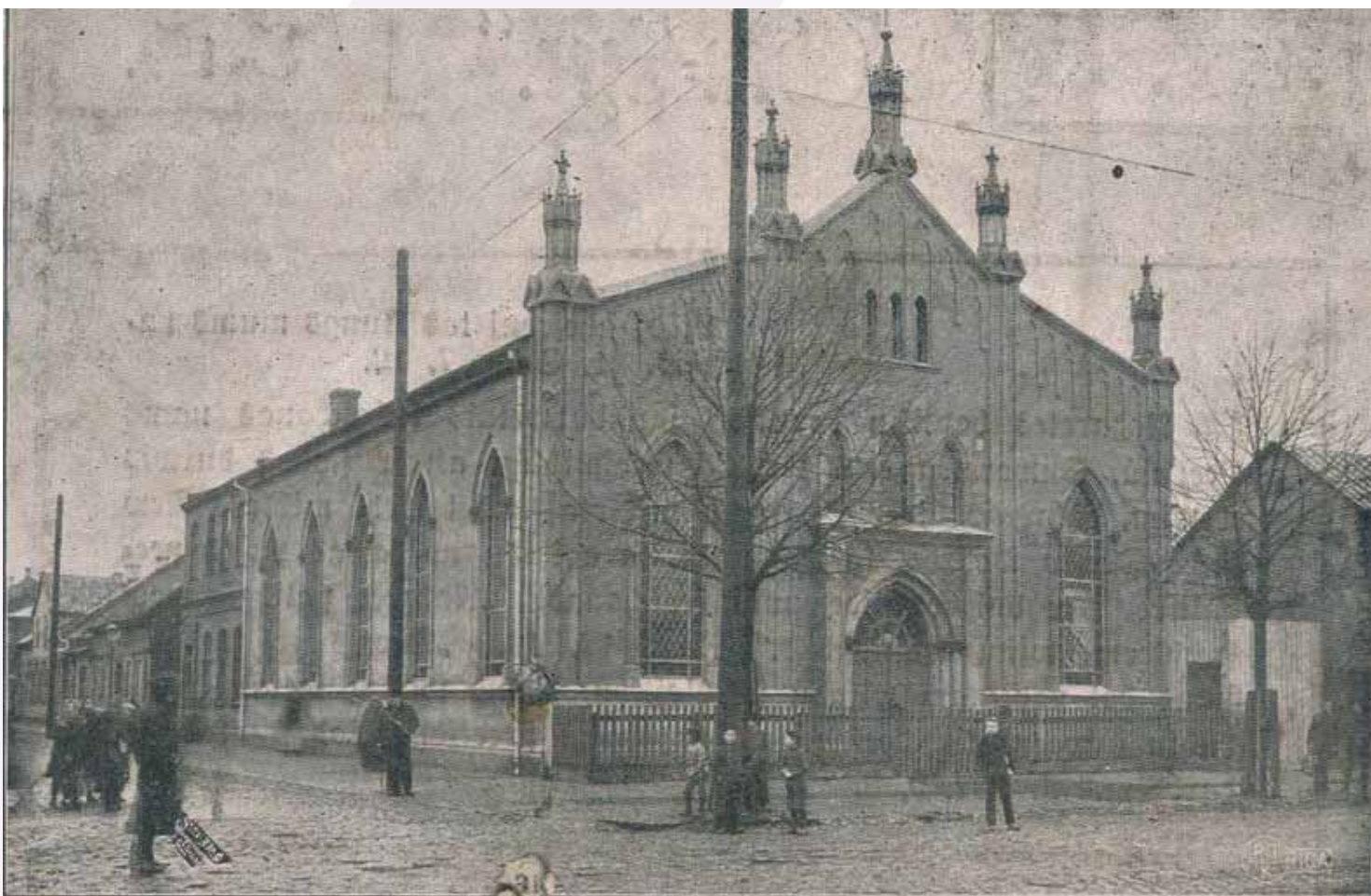
Nazaretas Latviešu Baptistu baznīca Liepājā.