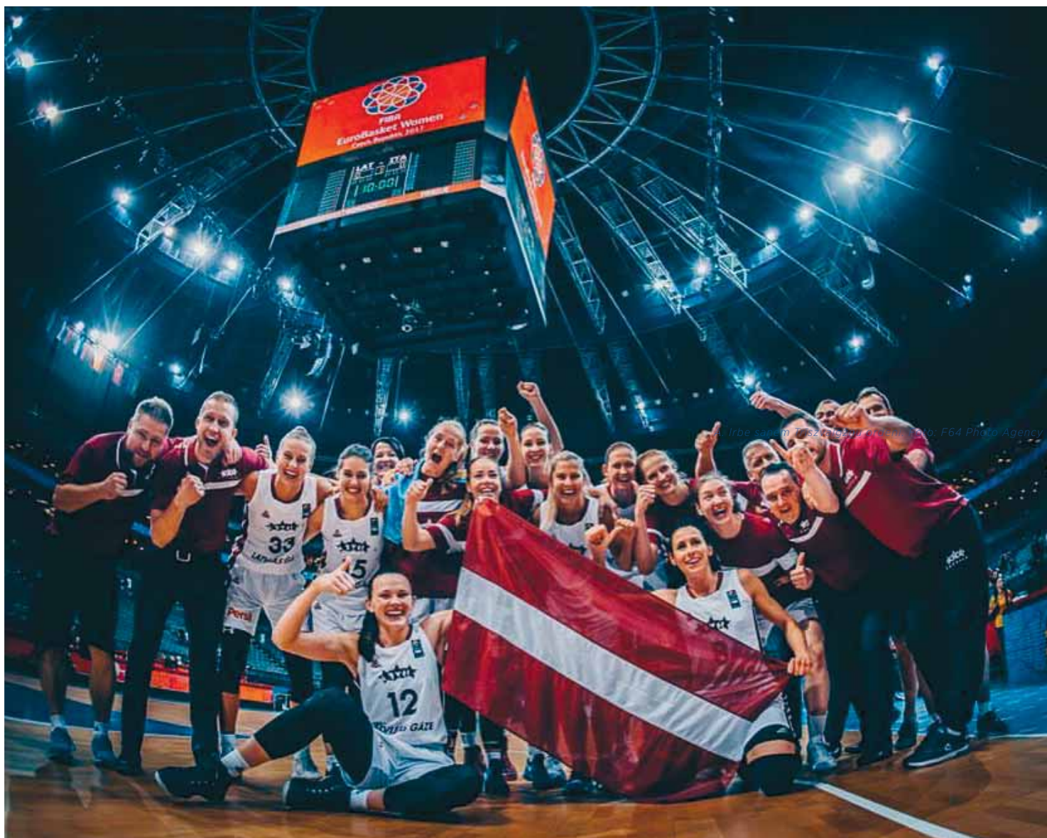
Kopā ar sieviešu basketbola izlasi pēc iekļūšanas pasaules čempionātā.