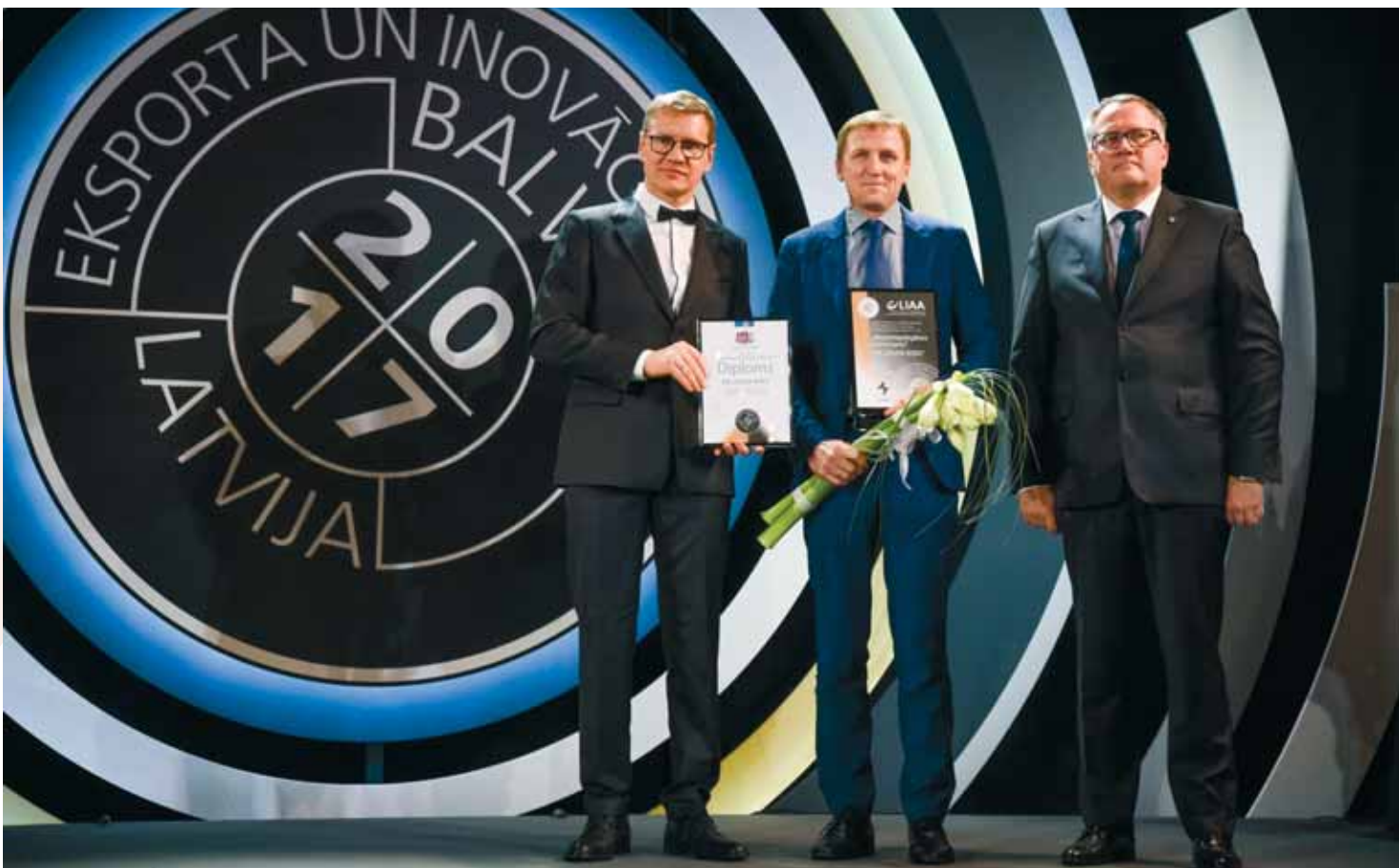
Šķērsot 2017. gada Latvijas eksporta un inovācijas balvu

atzinumu, jo ieguvām godalgotu vietu eksporta balvas konkursā. Tagad esam tiesīgi izmantot piešķirto titulu "Eksportspējīgākais komersants 2017", kas mums ļoti palīdzēs prezentēt sevi jaunajos tirgos.