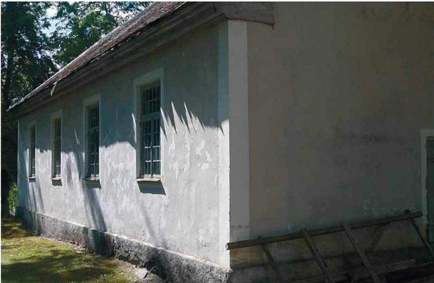
Apšuciema baptistu draudzes lūgšanu nams celts 1883. gadā un pēc kara atjaunots 1923. gadā.

– Prokrovskā. Visas šīs draudzes savu darbu izbeidza 1919. vai 1920. gadā, kad bēgļi atgriezās mājās.