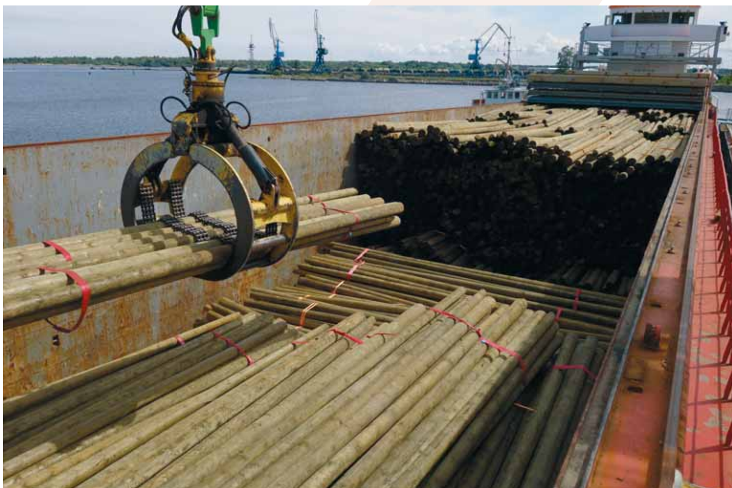
Eksporta krava ar impregnētu priežu elektrības stabiem

Ja palūkojas uz grafikiem, kuros viena no asīm ir laiks, tad redzēsim, ka tieši pēdējos 100 gados notiek ļoti straujas globālas pārmaiņas. Gan populācijas pieauguma, gan labklājības, gan ilgmūžības, gan daudzas citas līknes pēkšņi ir uzsākušas savu straujo augšupeju. Cik ilgi tā turpināsies? Varbūt līdz ar elektrības pieradināšanu un tehnoloģiju attīstību mēs strauji tuvojamiem loģiskajam risinājumam? Lai kā arī būtu, esmu ļoti pateicīgs par iespēju nodzīvot savu mūžu tieši šajā vēstures nogrieznī. Jo vairāk zināšanu mēs gūstam, jo konkrētāk paliek skaidrs, kas ir Dievs. Mums vairs nav jāpielūdz ne pērkons, ne saule, bet spēks, kas to visu ir radījis reizē ar saviem likumiem, kurus neievērojot, seko iznīcība. Attiecībā uz novēlējumu Latvijai ir aicinājums aizdomāties par Jēzus vārdiem, kad viņš runāja par vienotību (Mateja evaņģēlijs 12:25): "Ikviens valsts, kurā iekšējs naidis, aiziet bojā; un neviena pilsēta vai nams, kurā iekšējs naidis, nevar pastāvēt."