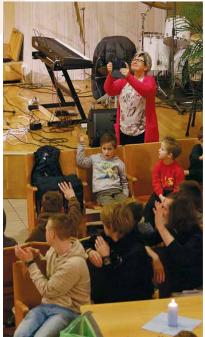
Māsa Solveiga "Iemūžina" pasākumu kopā ar bērniem un jauniešiem.